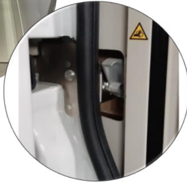
...Import und Einbauten der Zuziehilfe von AST-Technik, für ein leises Schliessen von Kastenwagentüren.