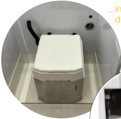
...Import und Einbauten von BioToi, der kompaktesten Trocken-Trenn-Toilette.