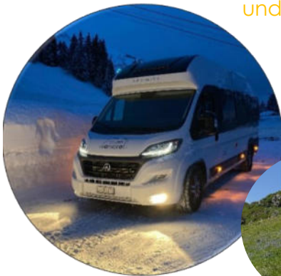
...Import und Verkauf des Affinity-Van.