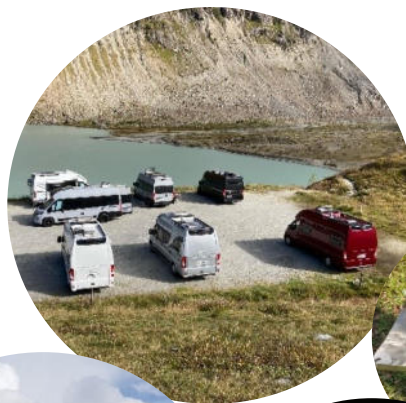
...und natürlich campen. 😊